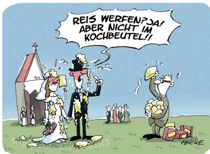
CARTOONS: TIM OLIVER FEICKE