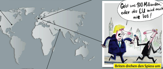
Briten drehen den Spieß um