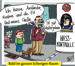
Bald im ganzen Schengen-Raum