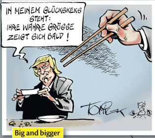
Big and bigger