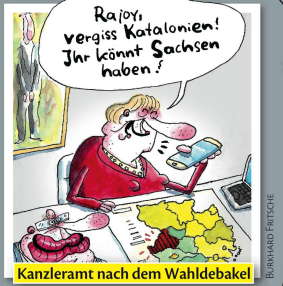
Kanzleramt nach dem Wahldebakel