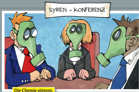
Die Chemie stimmt.