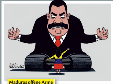
Maduros offene Arme