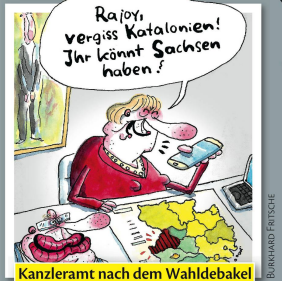
Kanzleramt nach dem Wahldebakel