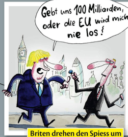
Briten drehen den Spieß um