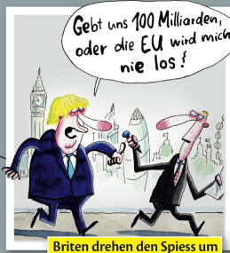
Briten drehen den Spieß um