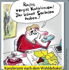
Kanzleramt nach dem Wahldebakel