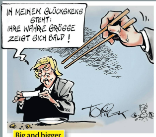
Big and bigger