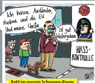
Bald im ganzen Schengen-Raum