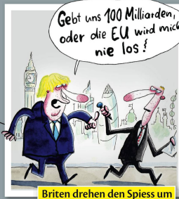
Briten drehen den Spieß um