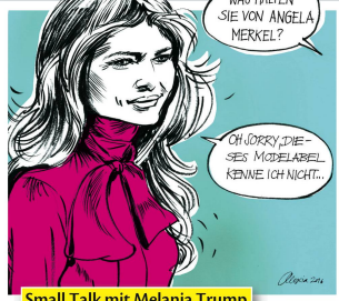
Small Talk mit Melania Trump