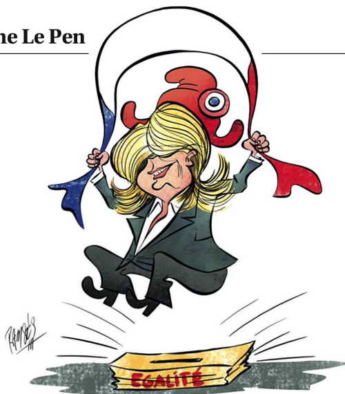
RAMISES MORALES IZQUIERDO