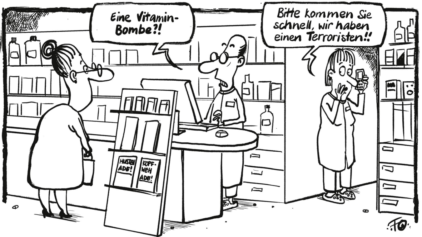
Das Bundesamt für Polizei hat sich an alle Apotheker gewandt und um aktive Hilfe in der Bekämpfung des Terrorismus gebeten. Sie sollen verdächtige Kunden auf einer Telefon-Hotline melden.