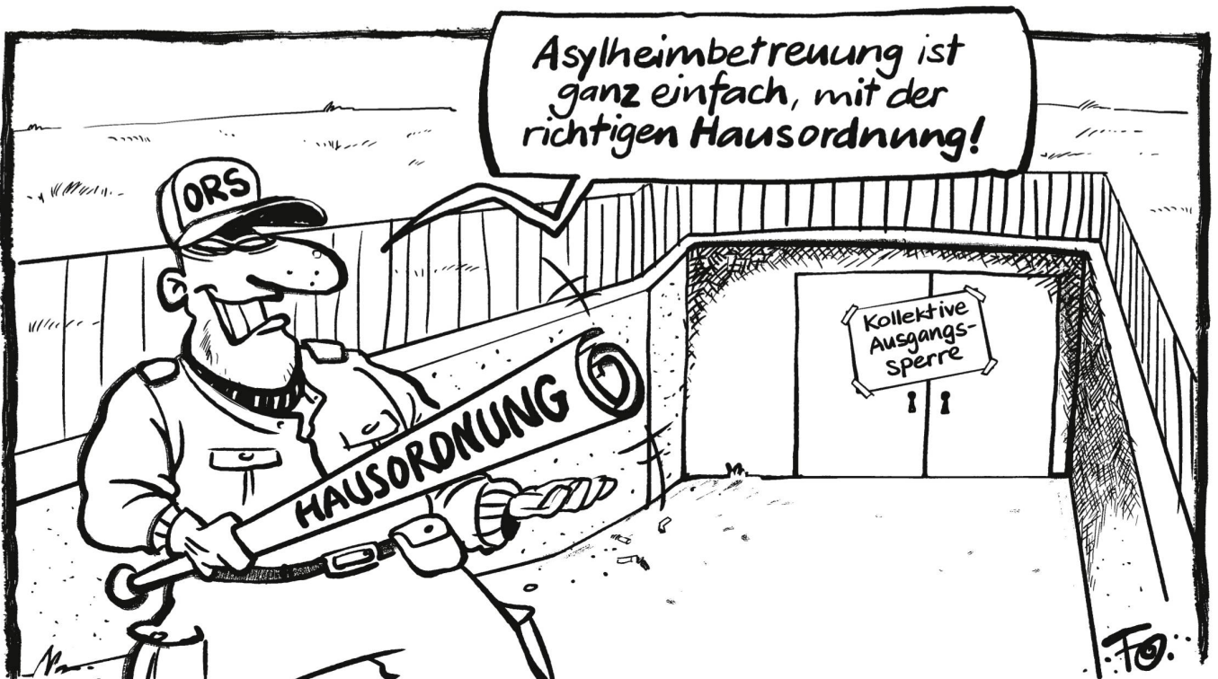
Die private Asylbetreuungsfirma ORS Service AG zog in der Asylunterkunft in Aesch (BL) ein strenges Strafregime auf. In einem umfassenden Regelwerk sind Sanktionen wie beispielsweise Kollektivstrafen festgehalten.