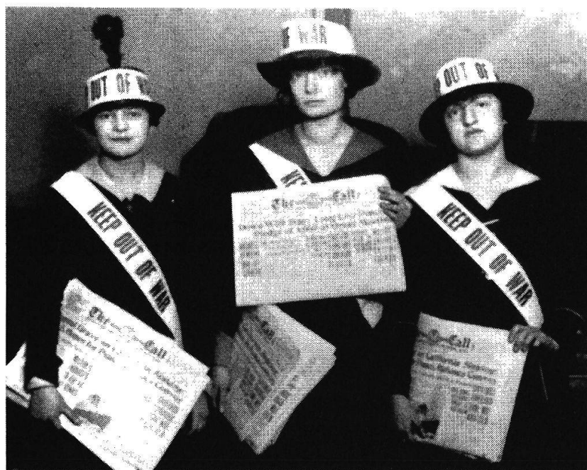
Dorothy (Mitte) verkauft, zusammen mit zwei Kolleginnen, The Call an einer Anti-Kriegsdemonstration, etwa 1916