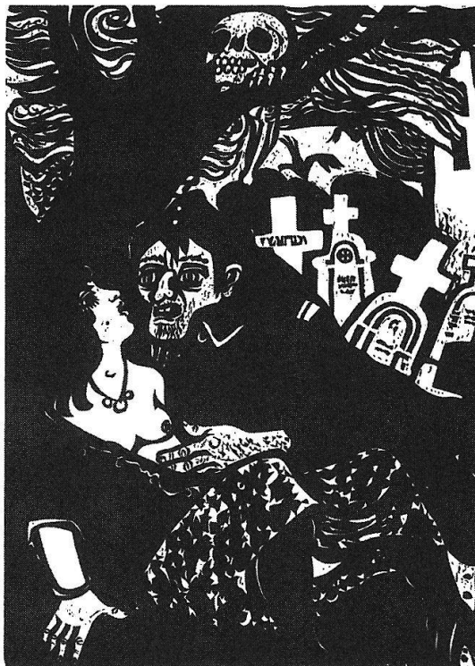
«Soldat und Dirne» (Holzschnitt von Heinz Keller).

ren «schwachen Geschlecht» das Zusammenleben neu zu organisieren ist die wesentliche politische Aufgabe im ausgehenden Patriarchat und wird uns noch lange beschäftigen. Der gewandelte Umgang mit der Geschichte ist ein wichtiger bewusstseinsbildender Bestandteil dieser Bewegung.