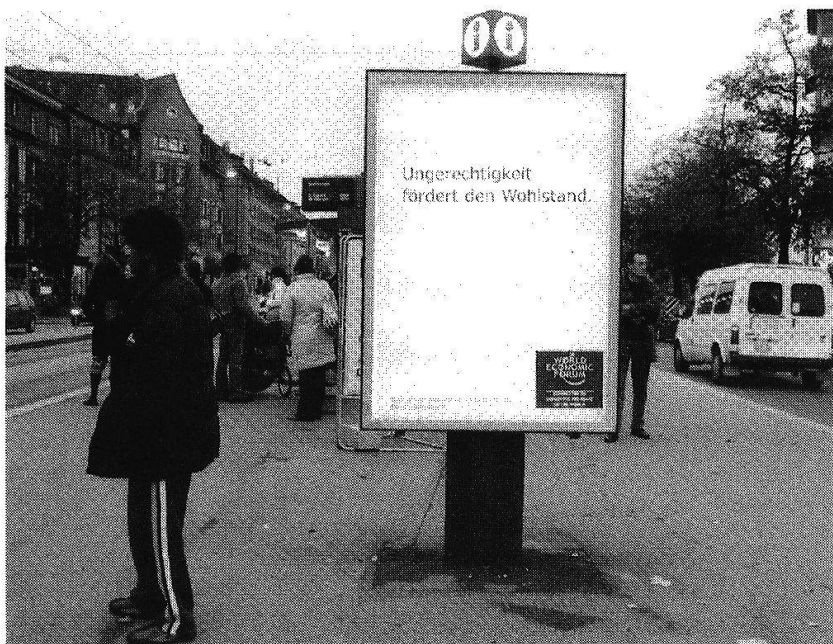
Postkartenaktion der Anti-WEF-Kampagne ( www.perspektivennachdavos.ch ).

Auf diesem Hintergrund ist zu verstehen, warum es der OeME-Kommission Bern-Stadt in kürzester Zeit und ohne grossen Aufwand gelang, für eine Petition an den Synodalrat beinahe 1200 Unterschriften zu sammeln. Dass dieses Mittel für eine Auseinandersetzung gewählt wurde, war für die Kirchenleitung ungewohnt. In der Petition wird der