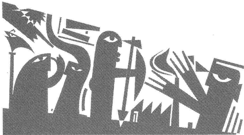
Wie werden Güter verteilt und verteidigt?.

11. Bis vor kurzem schien es, als bekämen Frauen Kinder unabhängig davon, ob sie als Mütter in Würde leben können. Heute zeigt sich, dass dies nicht mehr der Fall ist: Immer mehr Frauen sind nicht mehr bereit, Mütter zu werden, wenn sie damit die Aufgabe ihres Berufs, ihrer gesellschaftlichen Anerkennung und Teilhabe und ihrer finanziellen Unabhängigkeit riskieren oder gar ein Armutsrisko eingehen. In einer Ge-