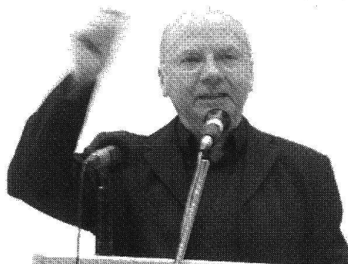
Jacques Gaillot am 4. Juni 2005 in Bern.

Gaillot erläutert seine Aussagen immer wieder anhand von Beispielen. Vor allem