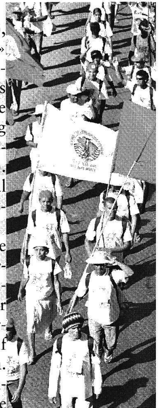
Marsch der Landlosenbewegung nach Brasília, Mai 2005.

Während die urbanen Volksbewegungen lange Zeit brauchten, um die unzähligen lokalen und regionalen Initiativen mit gemeinsamen Zielen zu vernetzen, wuchs auf dem Lande, was heute die wohl wichtigste Volksbewegung Lateinamerikas ist: die brasilianische