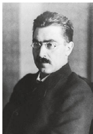
«Wenn wir Sozialisten sind, so sollten wir auch entsprechend leben, sollten sozialistisch leben! – Leonhard Ragaz.