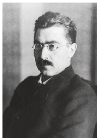
«Wenn wir Sozialisten sind, so sollten wir auch entsprechend leben, sollten sozialistisch leben! – Leonhard Ragaz.