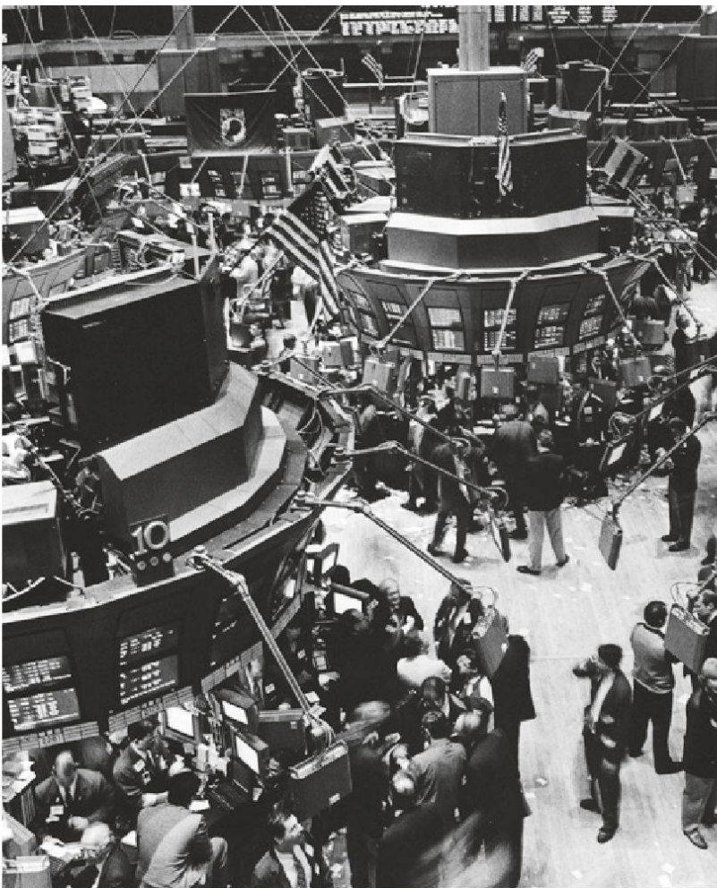
Blick in die New Yorker Börse

Walter Benjamin (1892 – 1940) war ein höchst eigenständiger Denker, der die Verflachung des Marxismus zu einem Konzept des technokratisch organisierten «Fortschritts» kritisierte. So setzte er sich lange vor der ökologischen Bewegung mit einem vulgärmarxistischen Verständnis von Naturbeherrschung auseinander, das die Rückwirkungen der Ausbeutung der Natur auf die Gesellschaft vollkommen ausblendet. Benjamin hatte einen guten Blick für das von den linken Intellektuellen seiner Zeit kaum Beachtete, am Rande Liegende. Dazu gehörte auch die Religion. Er befasste sich intensiv mit dem jüdischen Messianismus – dem Hoffen auf das Kommen des Erlösers und darauf, dass sich «die Erlösung in die geschichtliche Wirklichkeit umsetzt». 4 Davon zeugt auch einer seiner letzten Texte, die 1940 entstandenen Thesen «Über den Begriff der Geschichte». Gegenüber dem bürgerlichen Geschichtsbild des faktisch Gewordenen wie auch einem vermeintlich revolutionären Verständnis der Geschichte als einer unaufhaltsamen Aufwärtsentwicklung setzt er auf die von einer «schwache(n) messianische(n) Kraft» inspirierte Möglichkeit, «das Kontinuum der Geschichte aufzuspre-