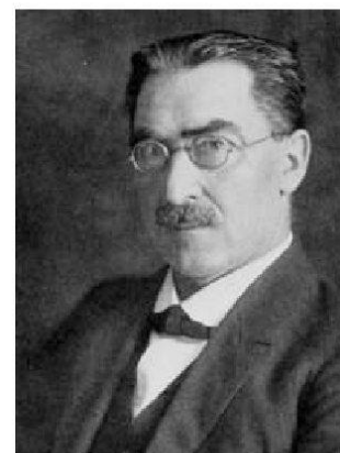
Leonhard Ragaz um 1915.

Drei Jahre später gründet Ragaz mit andern Theologen die Religiös-soziale Bewegung und die Zeitschrift Neue Wege . Bewegung und Zeitschrift vertreten immer dezidiert einen religiösen Sozialismus, dessen Kern der Glaube an den lebendigen Gott und sein Reich für die Erde ist. Der Ausblick auf das Reich Gottes weist über die Kirchenmauern hinaus in die Weltwirklichkeit . Etwa zur selben Zeit, wie Ragaz diese Worte schreibt, sagt ganz ähnlich der schwäbische Pfarrer und religiöse Sozialist Christoph Friedrich Blumhardt: Nicht dass du Christ bist, ist die Hauptsache, sondern dass Gott in der Welt ist .