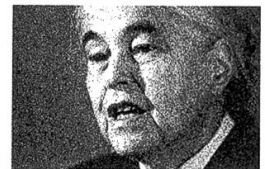
Anna Seghers, 1966.

So wie erst das Wagnis der Vision und Einbildungskraft zu einem lebendigen Realismus führt, so stützt auch der Glaube an Unirdisches den Glauben an Irdisches. Zumindest lässt der Aufbau des Essays diese Vermutung zu. Es ist, als würde Anna Seghers mit der Reflexion auf die unirdische Wirkung der gotischen Sainte Chapelle daran erinnern, dass Hegels Satz «Trachtet am ersten nach Nahrung und Kleidung, so wird euch das Reich Gottes von selbst zufallen», den Walter Benjamin über seine vierte Geschichtsphilosophische These gesetzt hat, auch nur gilt in der dialektischen Bewegung, die das Trachten nach dem Reiche Gottes und sei es nur jenes vergangener Epochen, bei der Suche nach Nahrung und Kleidung nicht ganz aus den Augen verliert. Hören wir nochmals Anna Seghers zum Schluss: «Das Glanzstück der Kapelle, das die meiste Mühe kostet, wird zuletzt eingesetzt. Solange die Rose noch fehlt, dringt das Tageslicht herein, so hart und so scharf wie seit acht Jahren. Der Friede ist solange noch unwirklich.» ●