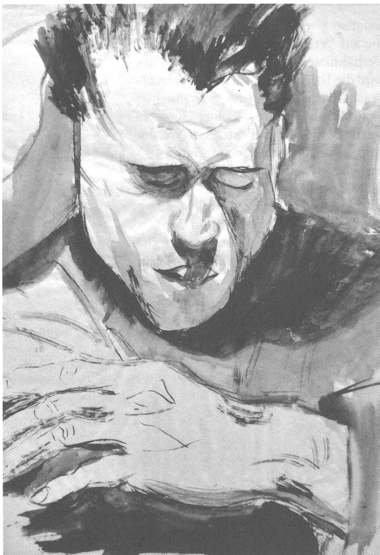
Alis Guggenheim, Männerporträt mit verschränktem Arm, 1930, Tusche auf Papier.

che Rechte und Pflichten für beide Geschlechter gelten. Die Menschheit findet schnell eine breite LeserInnenschaft in ganz Europa und begründet Weitlings führende Stellung in der frühen Arbeiterbewegung während des kommenden Jahrzehnts.