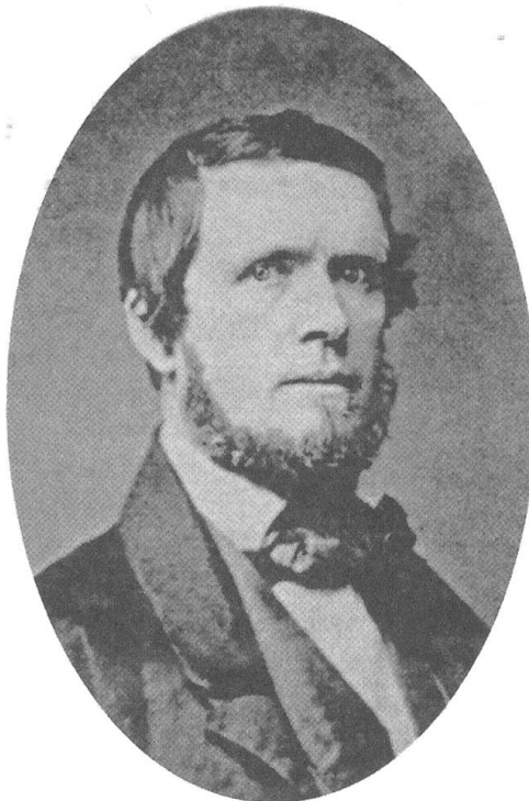
Wilhelm Weitling, 1808–1871: Schneider; Theoretiker des uto- pisch-revolutionären Arbeiterkommunis- mus

1836 spaltet sich der Bund. Weitling erarbeitet für den neuen Bund der Gerechtigkeit einen Programmentwurf: Die Menschheit, wie sie ist und wie sie sein