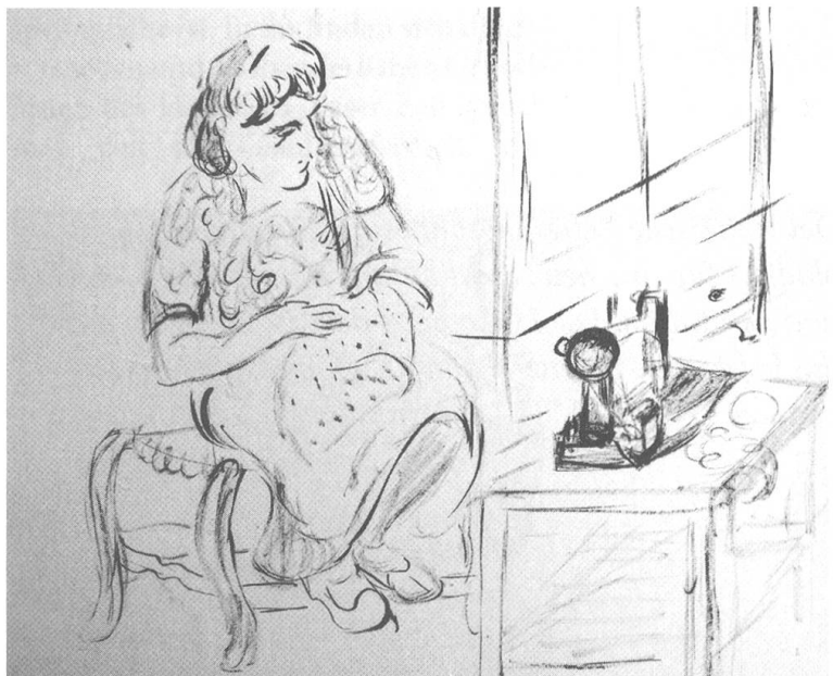
Alis Guggenheim, Sitzende nähende weibliche Figur, Jahr unbekannt, Tusche auf Papier.

Kunst unsichtbar machen. Die Plastik würde nicht zur übrigen Kunst passen, die im Volkshaus ausgestellt werde, so die Begründung der Herren. Alis wehrt sich gegen ihr normiertes Kunstverständnis und dagegen, dass nur bekannte Namen und den ArbeiterInnen plötzlich freundlich gesinnte Künstler ausgestellt werden. Ihr scheint fraglich, ob die ArbeiterInnen diese Kunst verstehen werden, da sie eine Sprache fern des All-