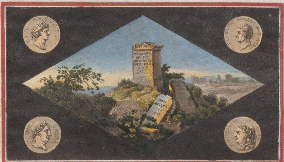
Su. Holeri Del.