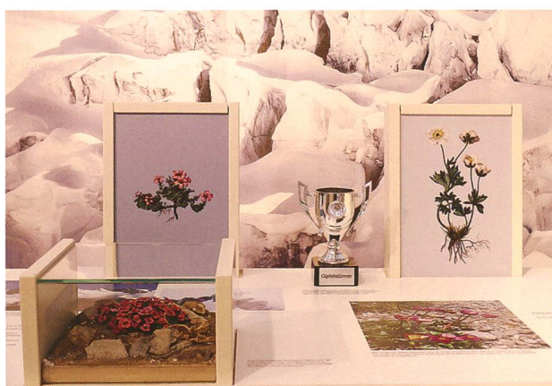
Abb. 3: Gegenblättriges Steinbrech und Gletscher-Hahnenfuss, zwei wahre Gipfelstürmer.

Waldgrenze (Abb. 1 bis 3). Auf einem Wanderweg steigt man von der Alp Tavaun (romanisch für Hummel) auf 1800 m ü.M. über das Hotel Alpendohle und das Munggenjoch hinauf zum Piz Crusch auf 3000 m ü. M. Unterwegs begegnen die Besucherinnen und Besucher ausgewählten Arten, einige davon zumindest dem Namen nach allgemein bekannt (z. B. Krokus, Bartgeier, Murmeltier), von anderen hingegen dürfte die Mehrzahl der Gäste kaum je gehört haben (z. B. Bärtierchen, Gletscher-Glasschnecke oder Gewimperte Nabelflechte). Die Mischung von (vermeintlich) Bekanntem und Unbekanntem kam beim Publikum sehr gut an, wie zahlreiche Einträge ins «Gipfelbuch» zeigten. Mit Augen, Gehör und Tastsinn liess sich überall Neues entdecken. Damit erfüllte die Ausstellung auch unseren Anspruch, auf die Naturschätze vor der Haustür aufmerksam zu machen und für die Bedeutung, aber auch Verletzlichkeit alpiner Naturräume zu sensibilisieren.