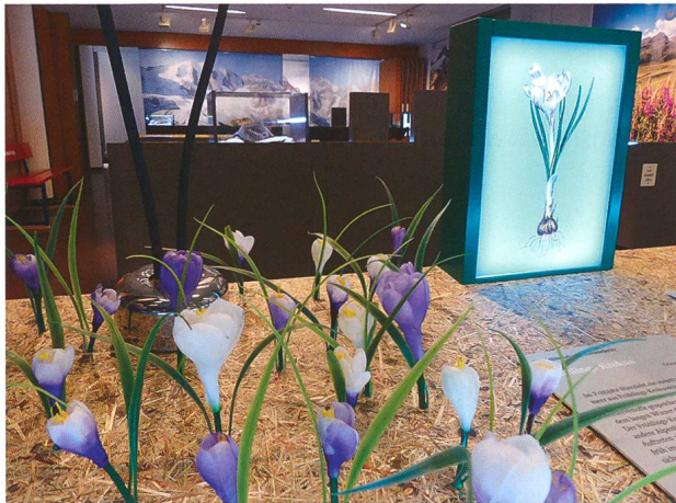
Abb. 1: Die Ausstellung «Gipfelstürmer und Schlafmützen – Tiere und Pflanzen im Gebirge», eine Eigenproduktion, war ab Mitte April 2019 bis Januar 2020 zu besichtigen.