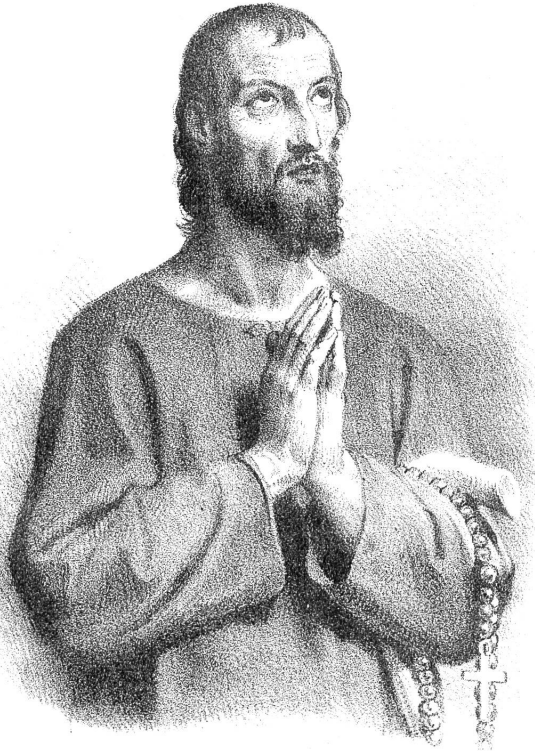
Bild des seligen Bruder Klaus und dessen Betrachtungstafel.

Mein Herr und Gott, nimm alles von mir, Was mich hindert zu Dir; Mein Herr und Gott, gib alles mir, Was mich fördert zu Dir; Herr, nimm mich mir und gib mich Dir, Und mach mich ganz zu eigen Dir.