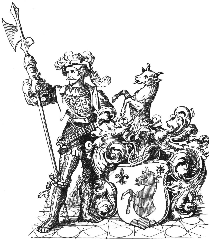
Wappen der Zelger.

Da besonders die Urner und Unterwaldner die Viehmärkte ennet dem Gotthard fleißig be- suchten, so gerieten sie mit den italienischen