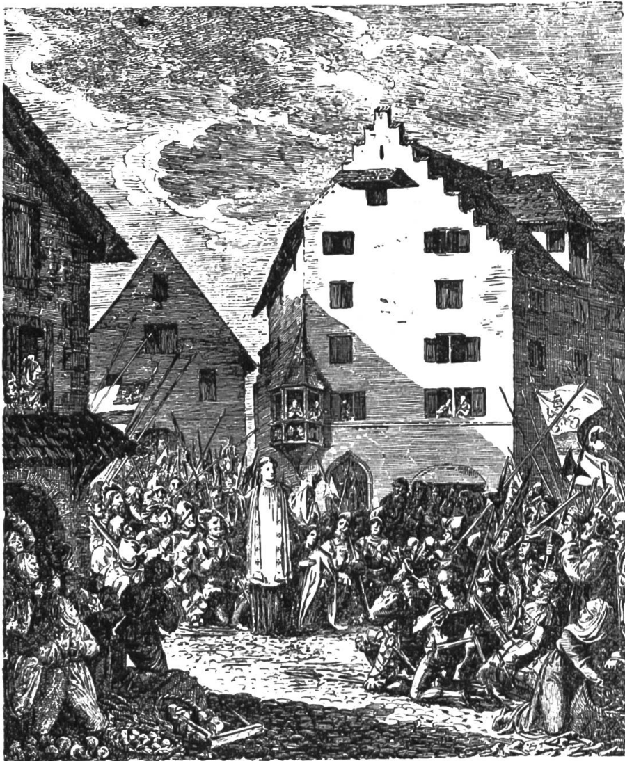
Die Truppen der kathol. Orte in Zug. Nach einem alten Kupferstich.