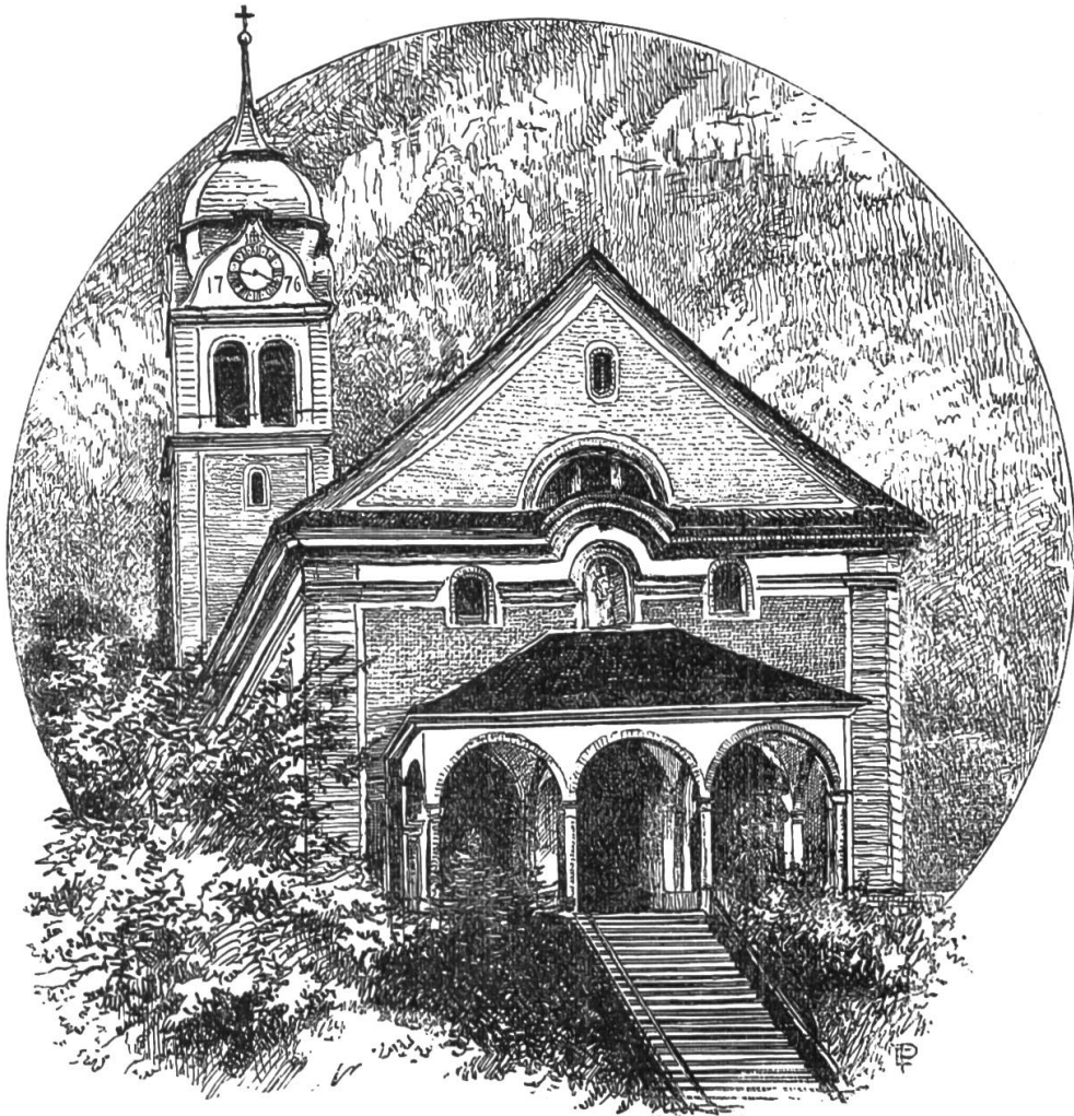
Die Pfarrkirche in Wolfenschießen.

Nachmittags 1 Uhr wurde der Sarg mit den ehrwürdigen Ueberresten von den Kaplänen zu Dallenwyl und Wiesenberg aus dem Pfarrhof in feierlicher Prozession in die neue Kirche übertragen und unter den Chorbogen niedergestellt. In der Prozession schritten mit brennenden Ker-