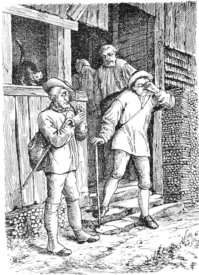
„B'hüet Gott, Vater, Mutter!“ sagte ich noch.

Im Toggenburgischen ging es uns nicht schlecht, dem Lunzi aber wollte es dort ganz und gar nicht gefallen. Er sagte, die Arbeit sei ihm da zu streng, die Kost zu schmal und der Lohn