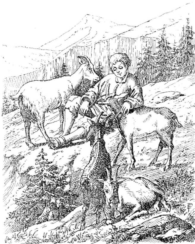
Ich wurde den Geißen immer lieber u. sie mir auch.

Meine Mutter, eine innig fromme Frau, setzte ihr ganzes Vertrauen auf den Herrn und die liebe Mutter Gottes. In der Nähe unseres Hauses stand ein altes, halb zerfallenes Helgenstöckli. Auf ihre Bitten besserte es der Vater wieder etwas aus und sie stellte ein Bild der schmerzhaften Mutter, das sie von ihrer Gotte sel.