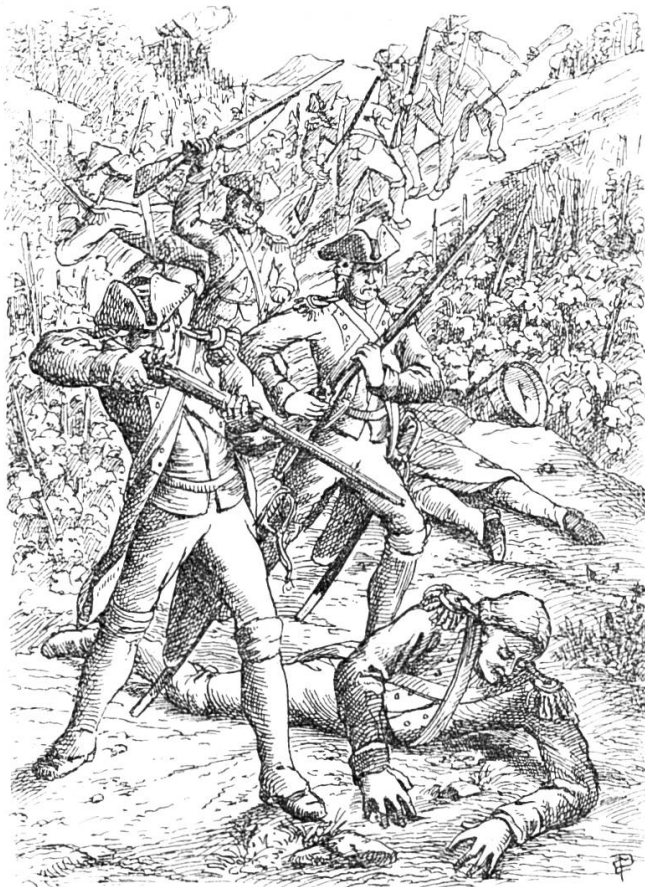
Surtig schlüpfte ich seitwärts durch die Neben.

Jetzt kam die Mutter heim, ich sprach sie um Nachtherberge an. Sie stuzte und schaute mich ein Schutzli lang an, — auf einmal schlug sie freudig die Hände über dem Kopf zusammen und rief: „Wigi! Wigi! Gewiß wahrhaftig, Wigili, du bist es!“ „Ja Mutterli, lieb's Mutterli!“ entgegnete ich und streckte ihr beide Hände entgegen. „Ich bin es, der Wigili!“