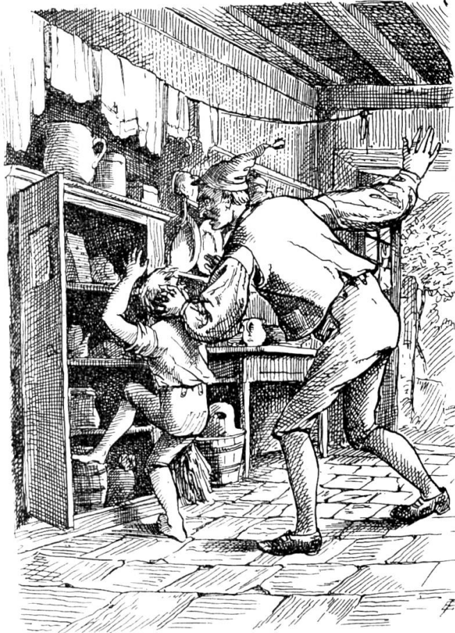
„Wart du Schelmenbuob!“