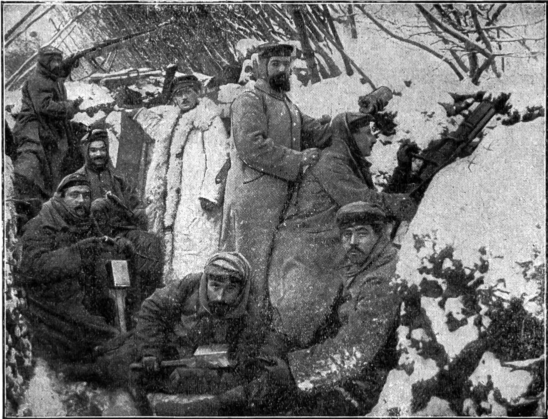
Vom Weltkrieg. — Im Granatengraben.

„Rasp! Rasp! Du hast mich gerettet? Mich? . . .“ schluchzte Anneli.