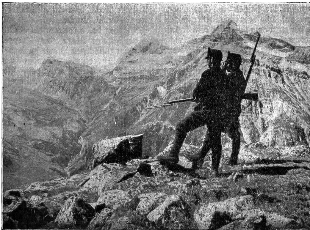
Von der Grenzbesetzung 1915. — Beobachtungsposten an der Südgrenze.