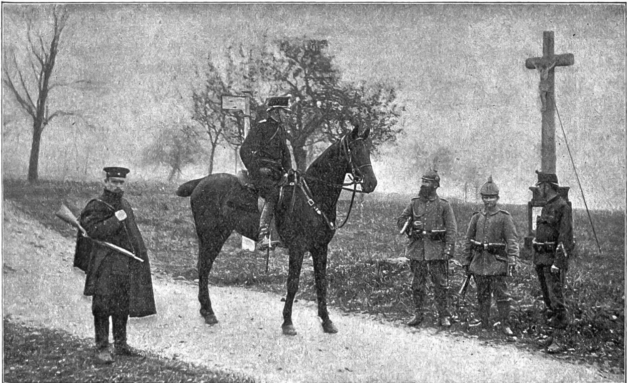
Von der Grenzbesetzung 1915 — Die Wacht am Grenzkreuz.

Rasp das alles so bedachte in einsamen Stunden droben auf der Alp, da schlug ihm das Herz fast hörbar unter dem luftigen Hirthemd. Aber das Anneli war des Hubelbauers einziges Kind, der drüben am Bürgen ein schönes Heim besaß. Konnte, er der Heimatlose, auch nur daran denken, den alten Hubel-Jakob einmal Vater nennen zu dürfen? Ach was! Es hatte ihm ja geträumt, das Anneli sei seine Tanzjungfer an seiner ersten Aelplerfilbi, die er dies