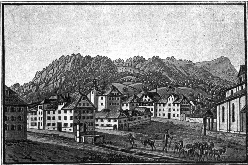
Der Dorfplatz in Stans zur Zeit des Ueberfalles.