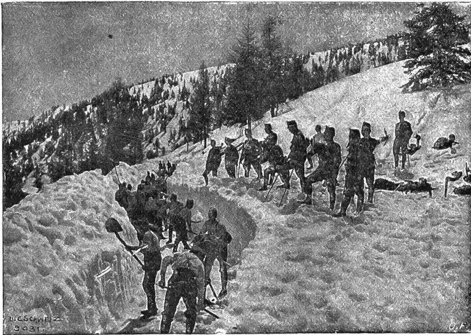
Von der Grenzwehr 1917. — Schneebrucharbeiten im Tessin.

klopste. Der Balz ging bedächtigen Schrittes an die Haustüre und fragte: „Was isch?“ „I bis, Balz, dr Hubelheiri.“ „So, so“, lams gedehnt zurück. „Was witt?“ „Land mi inä, i wett eppis mid iich redä.“ Da öffnete der Balz die Türe. Der Heiri kam mit kurzem: „Guaten Abig“ hinein und ging schweigend dem Balz in die Stube nach. Das Annili ging hinaus und hörte dann die beiden Männerstimmen laut miteinander sprechen, ja, der Heiri lärmte einmal laut auf, so daß das Annili einen jähen Schrecken bekam. Aber dann wurden die Stimmen leiser, und auf einmal ging die Türe auf und