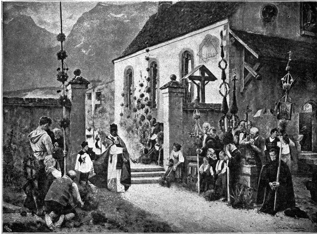
Die Palmenweibe am Seelen Sonntag. Nach einem Gemälde von H. Fellmann.