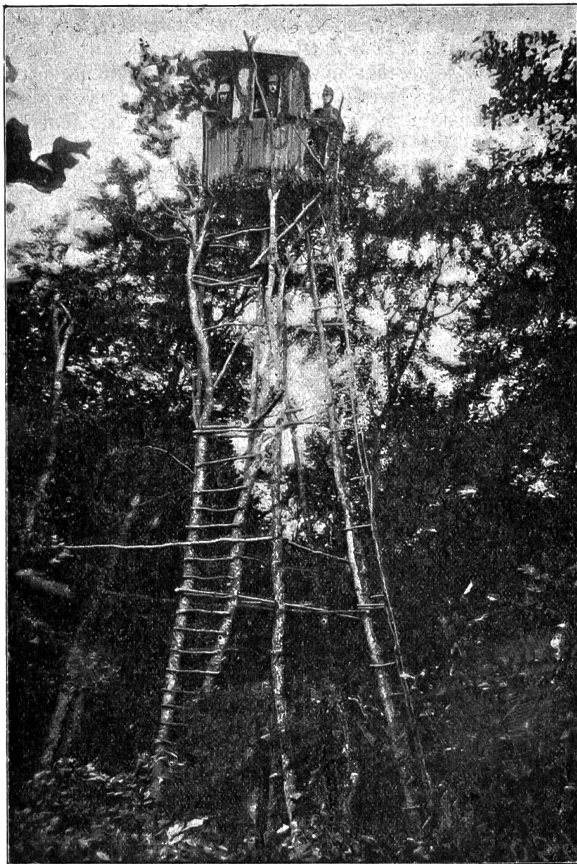
Von der Grenzwatch 1917. — Beobachtungsposten bei Courcelles.

wenn dr Fehn so gahd.“ Er beobachtete, wie es auf dem Trutthubel am Niederbauen schon anfang zu grünen. Auf den Matten um den Gaden weideten die Kühe und fraßen voll ungestümer Freßlust das saftige Gras. „Ich und di Vater hend im Sinn, zwänzig