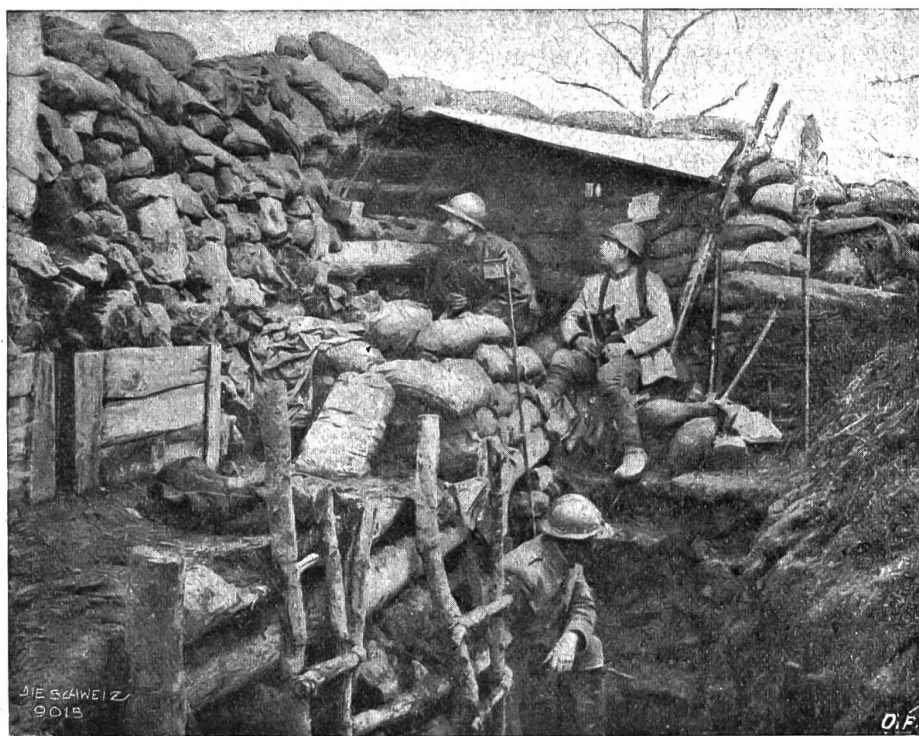
Vom Weltkriege. — Im vordersten französischen Schützengraben