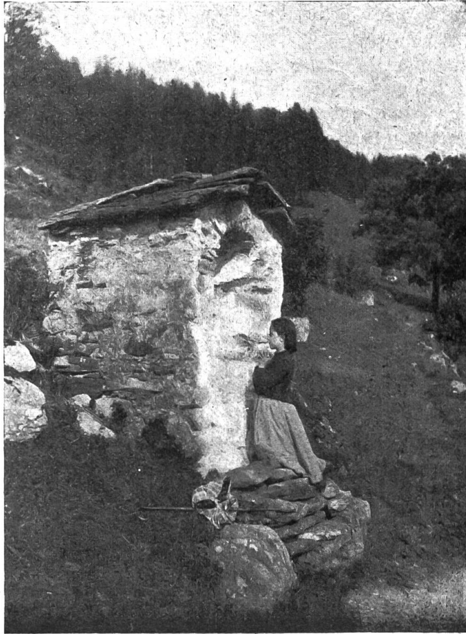
Ein Ave Maria beim Bildstöcklein.

Nei, Frau Posthalterin, 's frürt ein rächt, wenn mer so öppis ghört. Der alt Sepp hed meini finer Lättig guueg geschaffet, gschwizt und über d'Wält ie gschlage. Und wenn de Bären scho nümme so fest und storch gsi ist, so sind's doch no keni vier Wuche verby gsi, daß er ime frönde Kärrlipurft, wo hed