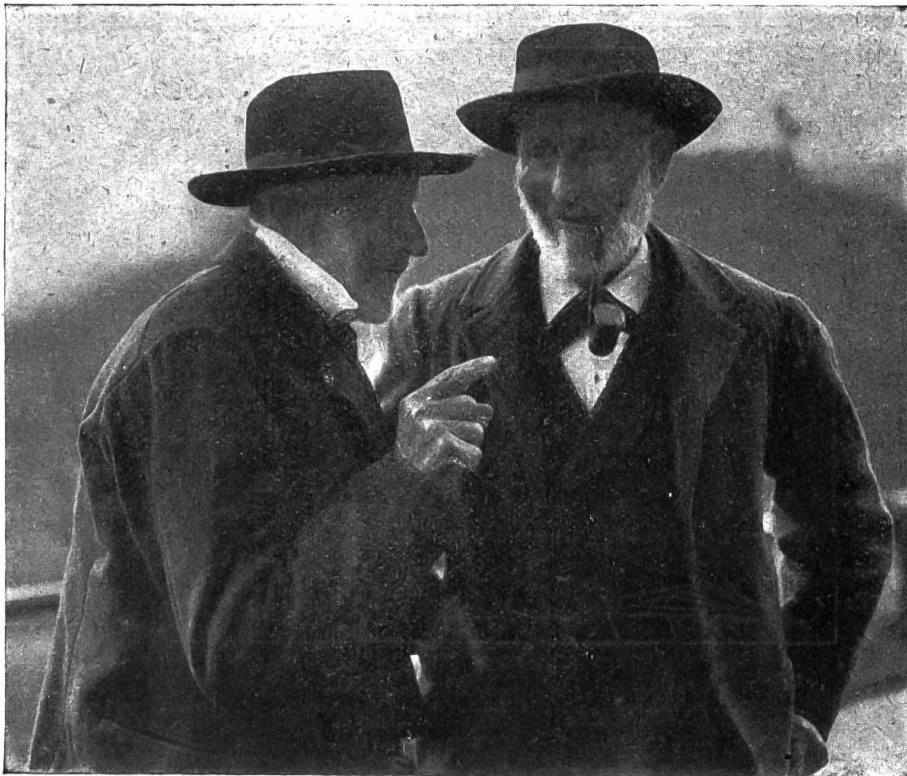
Zwei alte Politiker.

Luegid, Frau Posthalterin, öise Pfarer ist e brave und e rächte Heer, der ist sogar am Kolegi i de Stadt inne gsi. Und 's Predige verstohd er, as' nur no de Brobst im Hof so guet cha. De christelehret immer, me sel au kes Tier bloge; aber gönd, was will mer mache, wenn d'Chind deheime so nes Bispil vor Auge hend und so verzoge wärdid, wie