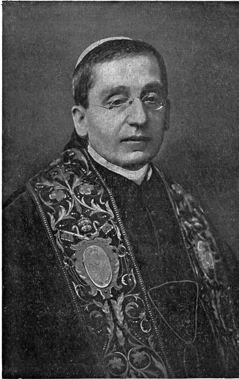
† Papst Benedikt XV.