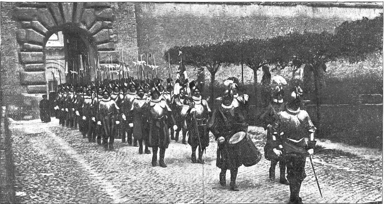
Aufzug der päpstlichen Schweizergarde zum Fahne eid.

landes. Wir sehen in euch nicht bloß die Söhne jener hohen Berge, von denen ihr Lehren der Treue, der Beständigkeit und Stärke empfanget für die treue Erfüllung der Pflichten unserer heiligen und christlichen Religion, ihr seid Uns Brüder jenes Bruders, den ihr „Bruder Klaus“ nennt und des sanften heiligen Bischofs von Genf, Franziskus. Ihr seid Uns nicht bloß die späten Nachkömmlinge Wilhelm Tells und eures rühmlichen Stauffacher, sondern vielmehr die neuen geistigen Kinder des Uns so teuren hl. Karl Borromäus, die treu und