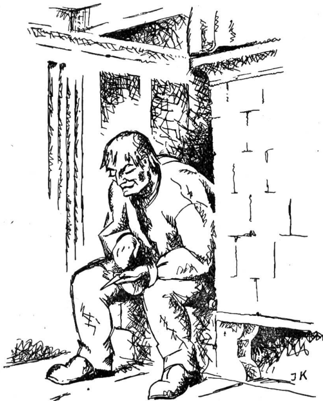
Mit lüsternen, kleinen, blinzelnden Augen streichelt er immer wieder den Dolch.