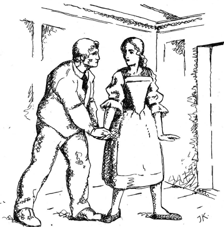
„Wir Frauen werden oft stark, wenn Männerstärke zunichte geht.“

„Keinen Schritt tu' ich mehr in jene Kammer. Hast du verstanden? Willst du, daß ich ihnen so in die Hände falle?“ Da schaute er sie mit entsetzten Augen an. Ist das noch dieselbe, die sich vor kaum einer Stunde in seine Arme geworfen, geweint und gejammert: Fliehen wir, verlaß mich nicht. — Beat, um aller Heiligen willen, gejammert hat: Fliehen wir, verlaß mich