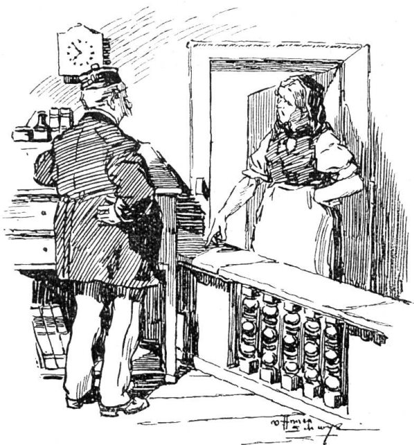
„... er solle ihr ein Gesuch schreiben, ein urchiges!“

„Jetzt hörts auf. Ich bin am Boden, jetzt muß er heim!“ Und sie lief ins Tal zum Gemeindepräsident, er solle ihr ein Gesuch schreiben, aber ein urchiges.