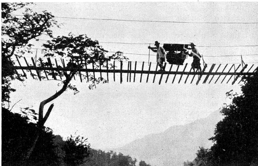
In der Sänfte ins Gebirge! 90jähriger japanischer Millionär läßt sich auf den 3000 Meter hohen Akaijiberg tragen. Die Sänfenträger beim Passieren einer Hängebrücke.

Dann hat sie sich um die Botengänge nach dem Städtlein angenommen, ist gerannt wie ein Postroß und hat geschleppt wie ein Packesel. Sie hat die Briefe in dem stillen Waldwinkel von der Post abgeholt und solche, die zur Post sollten, mitgenommen, hat dem und jenem gebracht, wessen