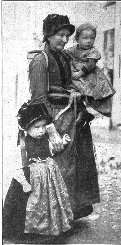
Lötschentalerin mit Kindern.

Und sie stieg langsam, sich haltend, die schmale, steile Holztreppe hinab in den Raum, der als Ausgang und Küche zugleich diente. Ein Windstoß hatte die Haustüre zugeweht, zu welcher Hans hinausgejagert war. Sorgfältig öffnete Christine sie wieder und befestigte sie mit einer Stobelle, damit sie offen bliebe. Sie lauschte