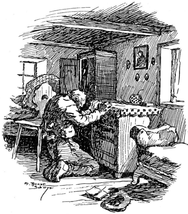
Laut gellten diese Worte auf den verdutzten Mann ein.

Heute mußte Anna die Väter zusammenrufen, aber nur Adolf und Thedöri ließen sich herbei. Eintönig klangen ihre Worte, und die Gedanken gingen stets denselben Weg: der Vater — das gemeinsame Elend. Die beiden Männerstimmen erstickten fast im Flüsterton. Ja, sie waren des Elends müde. Das Beten nützte nichts mehr. — Sie verziehen es dem Bruder, daß er nicht dabei war. Ob sie selbst auch zu beten aufhören wollten, darüber grübelten sie nicht. Sie beteten, weil die Mutter selig sie so