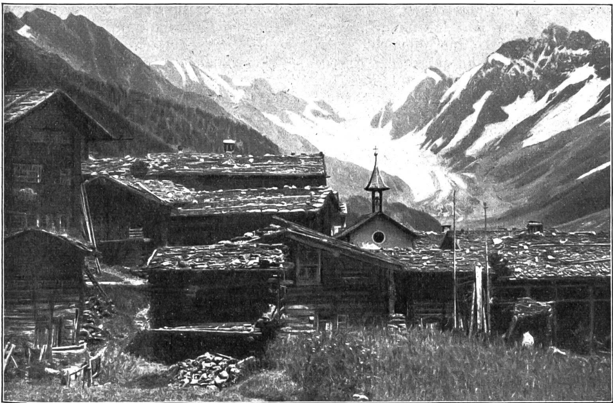
Weissenried im Lötschental.

von jenen, wo der äußere Schein, die oberste Haut ihres Wesens Rechtschaffenheit, kluge Lebenserfahrung und Gablichkeit bedeutet. Und ebenso im innersten Herzensfünklein lebte bei ihm Glaube, Zerknirschung und stürmisches Flehen. Aber was dazwischen lag, zwischen dem innersten Fünklein und der äußersten Haut, das war zerfressen von einem bösen Wurm, der Mark und Gebein, Fleisch und Nerven zernagt. Wer nur des Sunnacherers Gesicht sah, etwa am Sonntag auf dem Kirchplatz, oder an einem Markt,