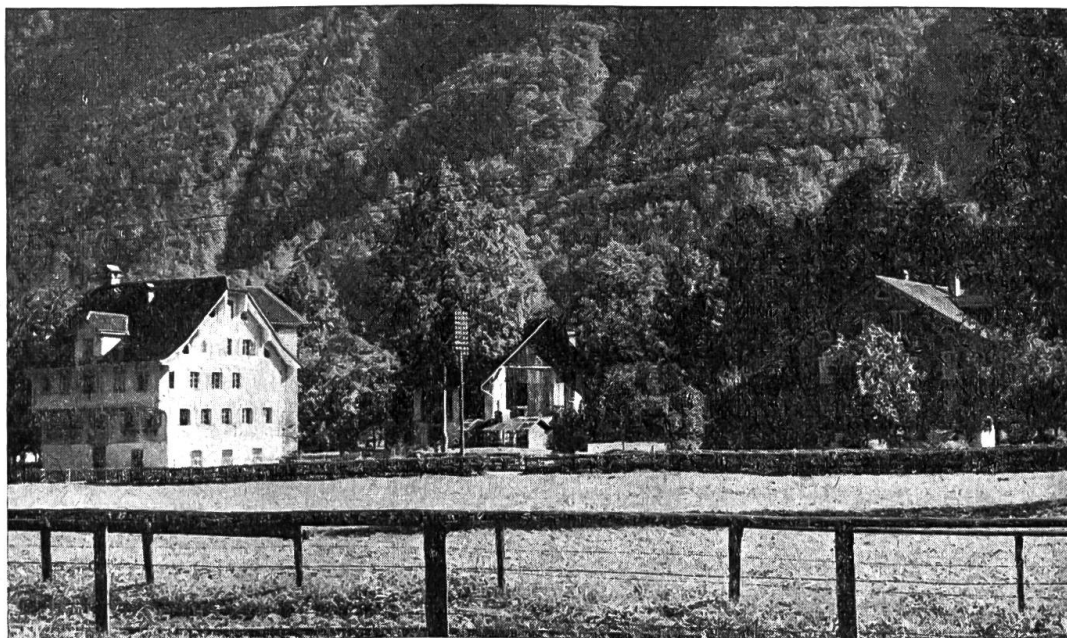
Bisheriges Waisenhaus (links) und ehemalige Dechwanden-Anstalt (rechts).