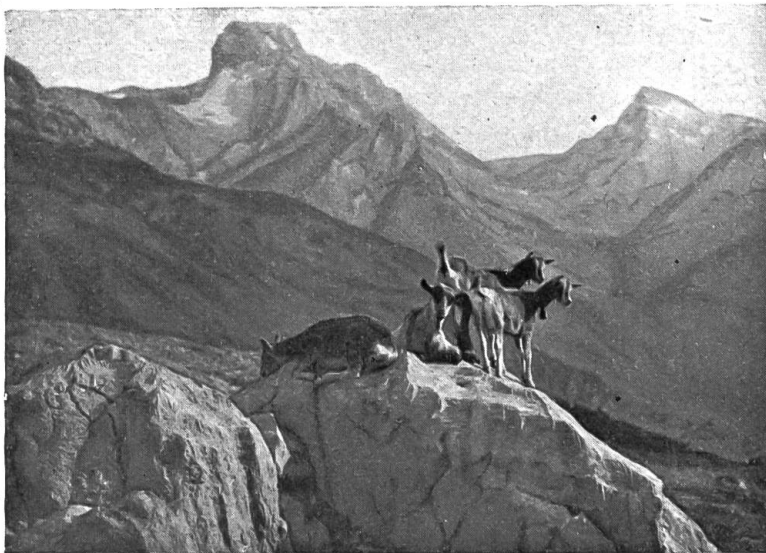
Giz, giz, giz!

Immerhin, so ganz ohne praktische Vor- schläge wollen wir nicht abschließen.