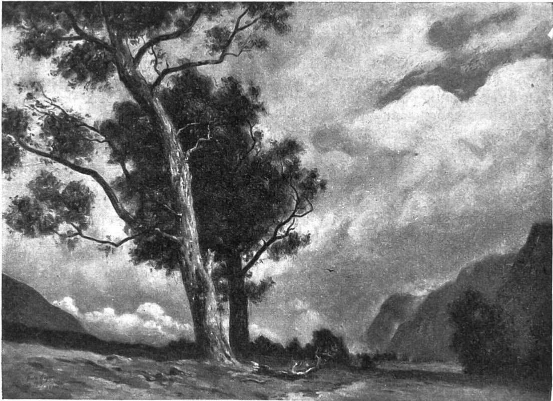
Gewitterstimmung in den Bergen.

der Brüder erst vor sie treten mußte mit seinem unsichern Blick und heiß geröteten Wangen, mit der Sündermiene, da hatte sie volle Gewißheit. Sie ließ sofort auch den Ältesten rufen und die andern, die nachträglich sich mit der Sache verwickelt hatten. Der Älteste rock die scharfe Lunte. Er kam nicht. Die andern wurden ins Kämmerchen dirigiert. Daß die Sache nicht sauber war, wußten auch sie. Was sie aber der Mutter