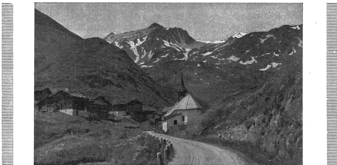
Im stillen Bergtale.

welche die engste Bedürftigkeit ihr noch übrig ließ. Bald gingen ihm alle Haare aus, er hatte das Nervenfieber. Für die Mutter rückten nun erst recht böse Tage an.