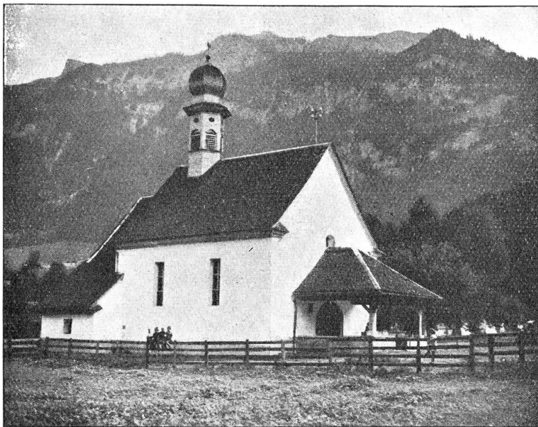
Beatenkapelle in Obsee bei Lungern

Zu St. Beaten waren also Altäre und Reliquien verschwunden, aber die Kapelle und das Pilgerhaus standen noch. Es ist nun wieder ein bezeichnender Zug für den unbesiegligen Glaubenseifer der Unterwaldner, daß sie immer noch zur Beatenhöhle wallfahrteten. Deshalb wurde nach