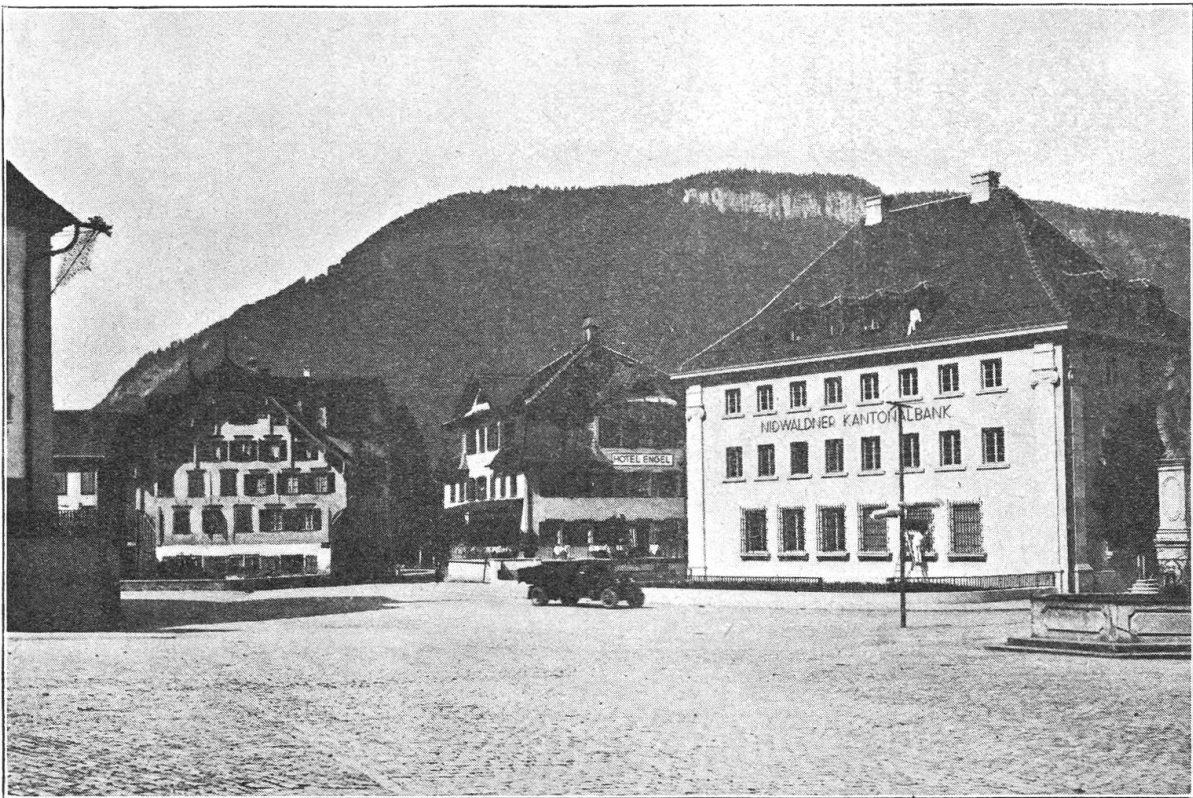
Der heutige Stanser Dorfplatz.

Zugleich rannte sie hinauf zur Knechtekammer und rief: „Sepp! Migi! Chasp! Kommt schnell! Räuber sind da — Einbrecher!“