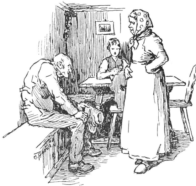
Zuletzt stellte sie sich breit vor den Besucher hin.