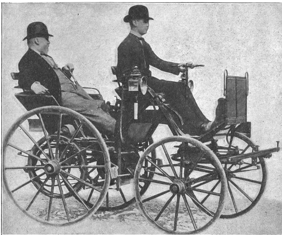
Erstes vierräderiges Daimler-Auto mit dem Spitznamen „Stinkwägel“. Auf dem Rücksitz Gottlieb Daimler.

kessel, die Heizung, die Zylinder und das prachtvolle Kamin unbedingt dazu gehören, nur die Räder könnten beim Dampfautomobil leichter gebaut sein als bei der Straßenzwalze. Nun denke man sich dazu noch einen weiß befrachten Chauffeur und die