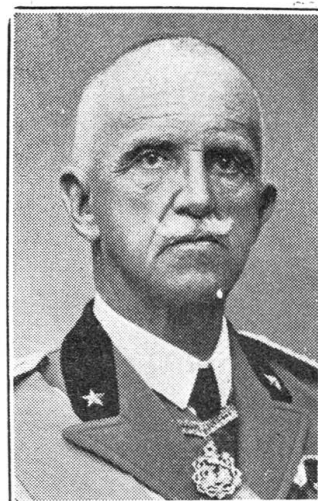
König Victor Emanuel von Italien der neue Kaiser von Abessinien

„Recht ist, was uns nützt.“ Hitler hat dem kranken Europa manch bittere Medizin in den Mund geschüttet, so daß es husten mußte, ausspuckte, aber doch schließlich geschluckt hat. Im Zerreißen von Verträgen scheint Hitler ein Meister zu sein. Alle Rüstungsverträge hat er zerschossen. In den Rüstungsfabriken Deutschlands hämmert, lärmt und kracht es noch mehr als auf Bannalp. Heute rüstet das deutsche Volk, wie kein Land je in solchem Tempo es getan hat. Sein oberster Bankier