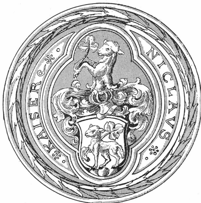
Nach Siegelabdruck-Copie im Rathaus Stans.

Wappen: Nach rechts über grünen Dreieck berg schreitendes weißes Lamm trägt ein grünes Kleeblatt im Vorderlauf in Gelb.