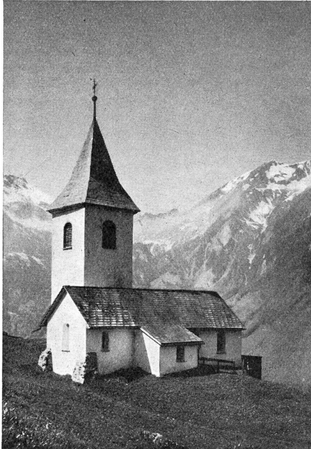
In der Kapelle St. Joder in Altzellen

len und der Aniri Allmend und um jene Stelle, wo auf einem abgeflachten Hügelvorsprung ein altes Tätschhäuschen sich befindet. Vielleicht besteht ein Zusammenhang dieser Stiftung mit dem kleinen Haus, das am Weg nach dem Gott-hardli gestanden und zum Wang in der Aniri gehörte. Der „Biremigili Mariä“ erzählte mir vor just 20 Jahren, das kleine spitzgiebelige Häuschen zu oberst in seiner Matte sei als Behausung erbaut und gestif-