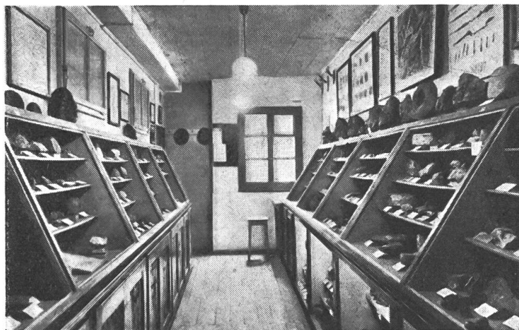
Blick in die Sammlung der Versteinerungen

schwimmende Korallen, pflanzenähnliche Seelilien, Würmer und Krebse. Letztere waren kopfgepanzerte, häßliche Tiere mit sehr vielen Füßen. Sie waren größtenteils augenlos. Es scheint demnach, daß dazumal noch Finsternis oder doch nur spärliche Helle auf der Erde gewesen sein muß. Kein Vogel belebte die Luft.