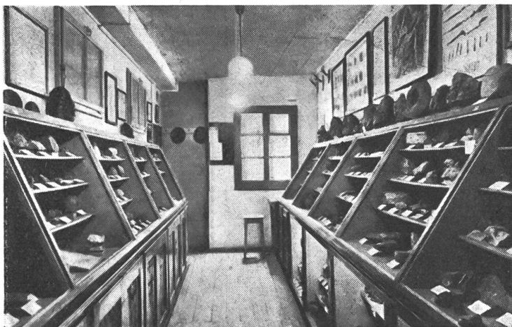
Bild in die Sammlung der Versteinerungen

Während der N e u z e i t war das Klima milder und wärmer als heute. Palmen, Lorbeer und Kampfer gediehen. In der Mitte dieses Zeitabschnittes gingen gewaltige Gebirgsentfaltungen vor sich. Die Tiere und Pflanzen sind nach und nach zu der Gestalt gelangt, wie wir sie heute noch haben. Es tummeln sich auf dem Festlande riesige Elephanten, Nashörner, Höhlenbären usw. Wir haben erstmals Wälder in heutigem Sinne des Wortes. Die Vögel sind in großem Reichtum der Arten vertreten. Die Anorbels-Fische werden durch die Knochenfische ersetzt. In den Meeren wimmeln Muscheln und Schnecken wie heute.