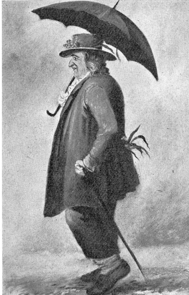
Der „Tirlitoktor“ auf seinem täglichen Spaziergang, so wie er auch heute noch in der Erinnerung des Volkes fortlebt

Etwa 10 bis 12 Personen aus verschiedenen Himmelsgegenden standen oder saßen, wenn sie Platz fanden, im Stübchen herum, alle die Blicke mit Ehrfurcht und Spannung auf den „Wundermann“ gerichtet. Ich hatte mich nahe bei der Türe aufgepflanzt, erhielt aber alsbald ein Plätzchen zum Sitzen zwischen den Trophäen aller magischen Künste. Daß auch ich ganz Aug