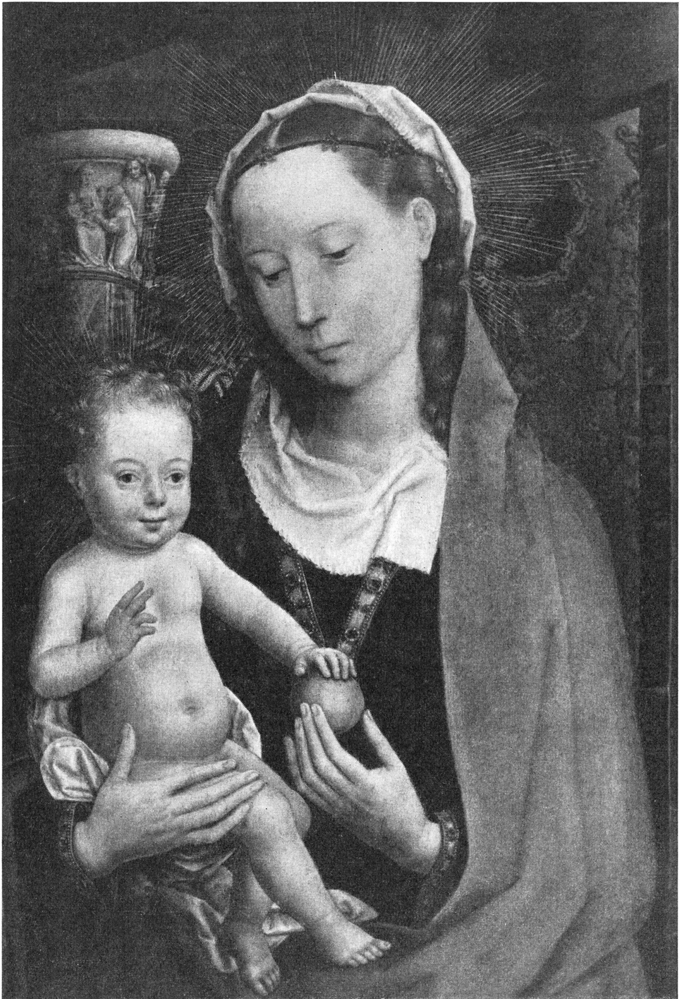
Maria mit dem Kinde / Ausschnitt aus einem Gemälde von Hans Memling